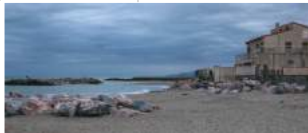
Illustration de l'effet de l'artificialisation (épis et brise-lame) et de l'urbanisation du littoral sur le phénomène d'érosion à Sainte-Marie-la-Mer (Rozec, PNMGL/OFB, 2018)

Aujourd'hui, l'augmentation de la vulnérabilité des côtes est très marquée, les risques naturels menacent les enjeux humains, socio-économiques et patrimoniaux sur le littoral du Parc.