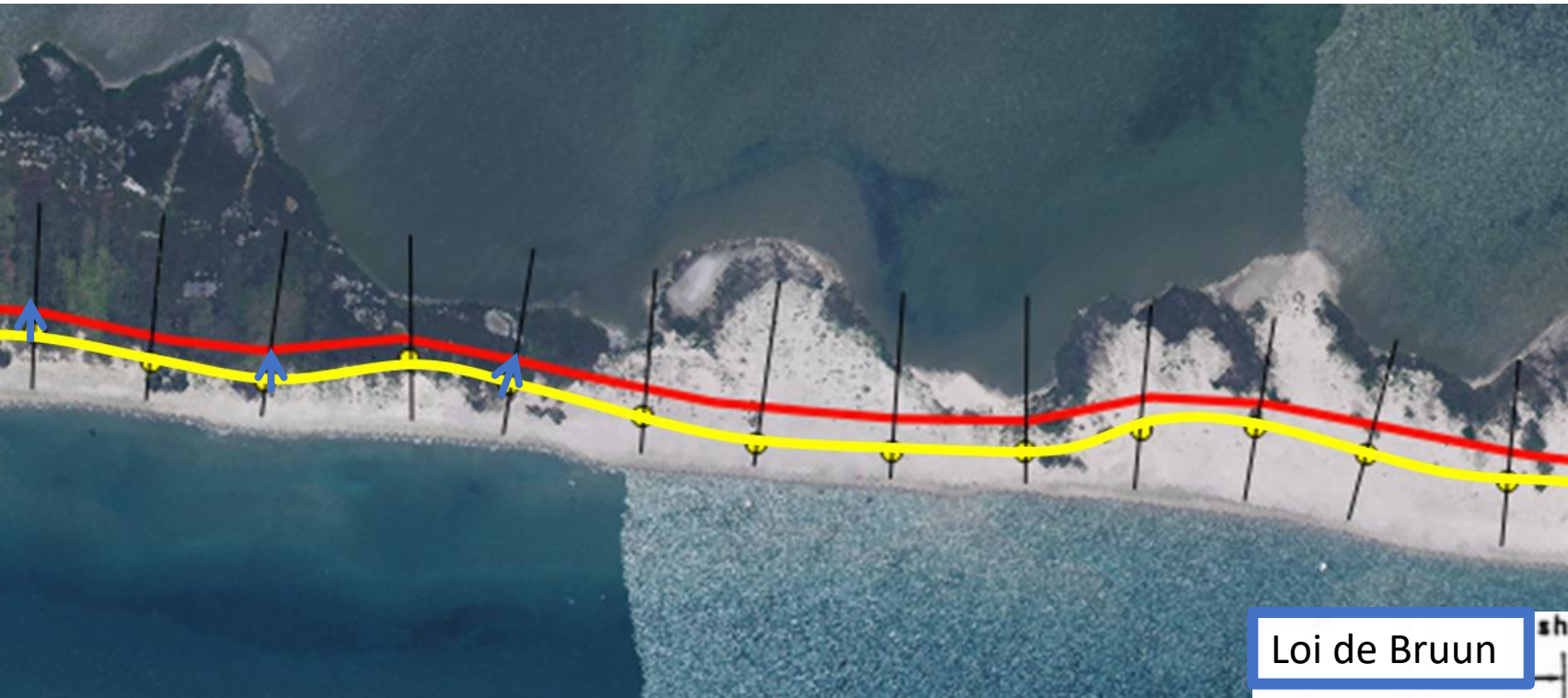
Loi de Bruun

Pour obtenir la ligne rouge, on a fait appel à la règle de Bruun (1962)