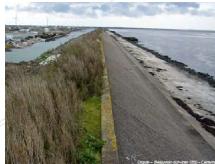
Digue - Mauvoisin-sur-mer (85) - Corinne